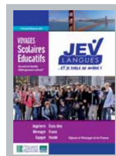
Brochure Voyages Scolaires Educatifs