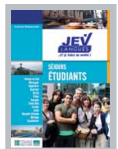
Brochure Etudiants, séjours en écoles de langue