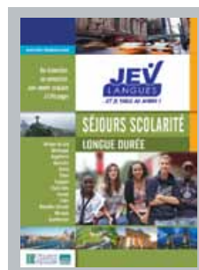
Brochure Scolarité, séjours longue durée

Demandez votre exemplaire ou téléchargez nos brochures sur www.jev-langues.com